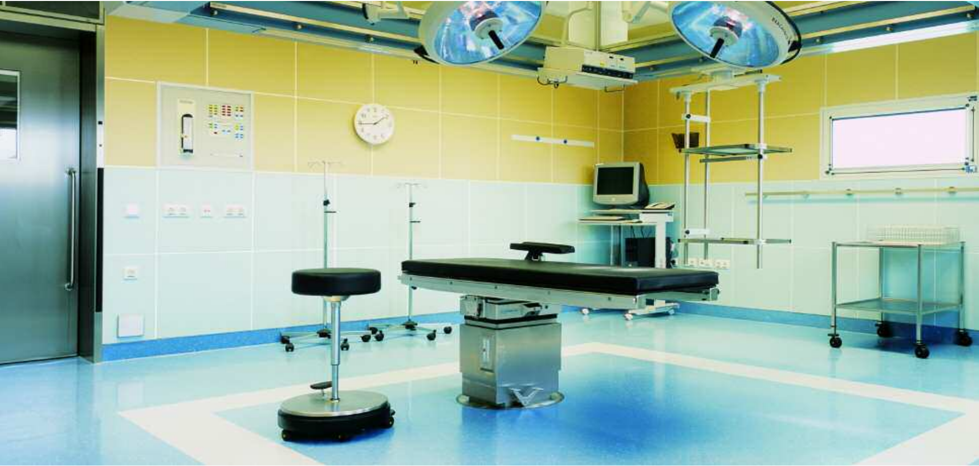
Abb. links: St. Bernhard Krankenhaus, Hildesheim/Deutschland Architekt: Lohr Architekten