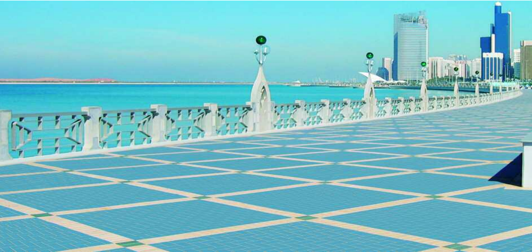
Abb. links: New Corniche Road East, Abu Dhabi/Vereinigte Arabische Emirate Architekt: De Leuw Cather International

Abb. Mitte: Wohngebäude, Berlin/Deutschland