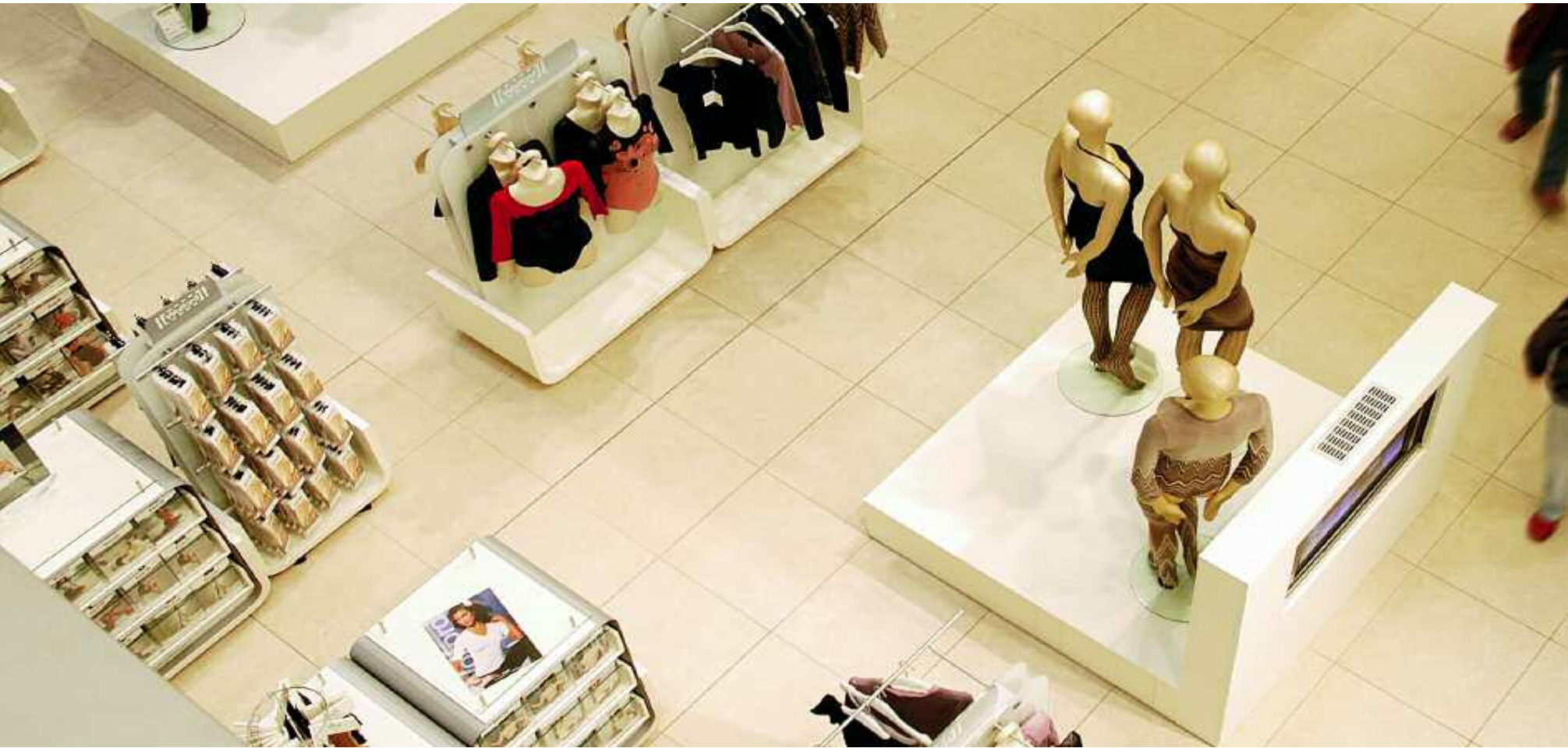
Abb. links: Galeria Kaufhof, Berlin/Deutschland Architekt: Kleihues + Kleihues