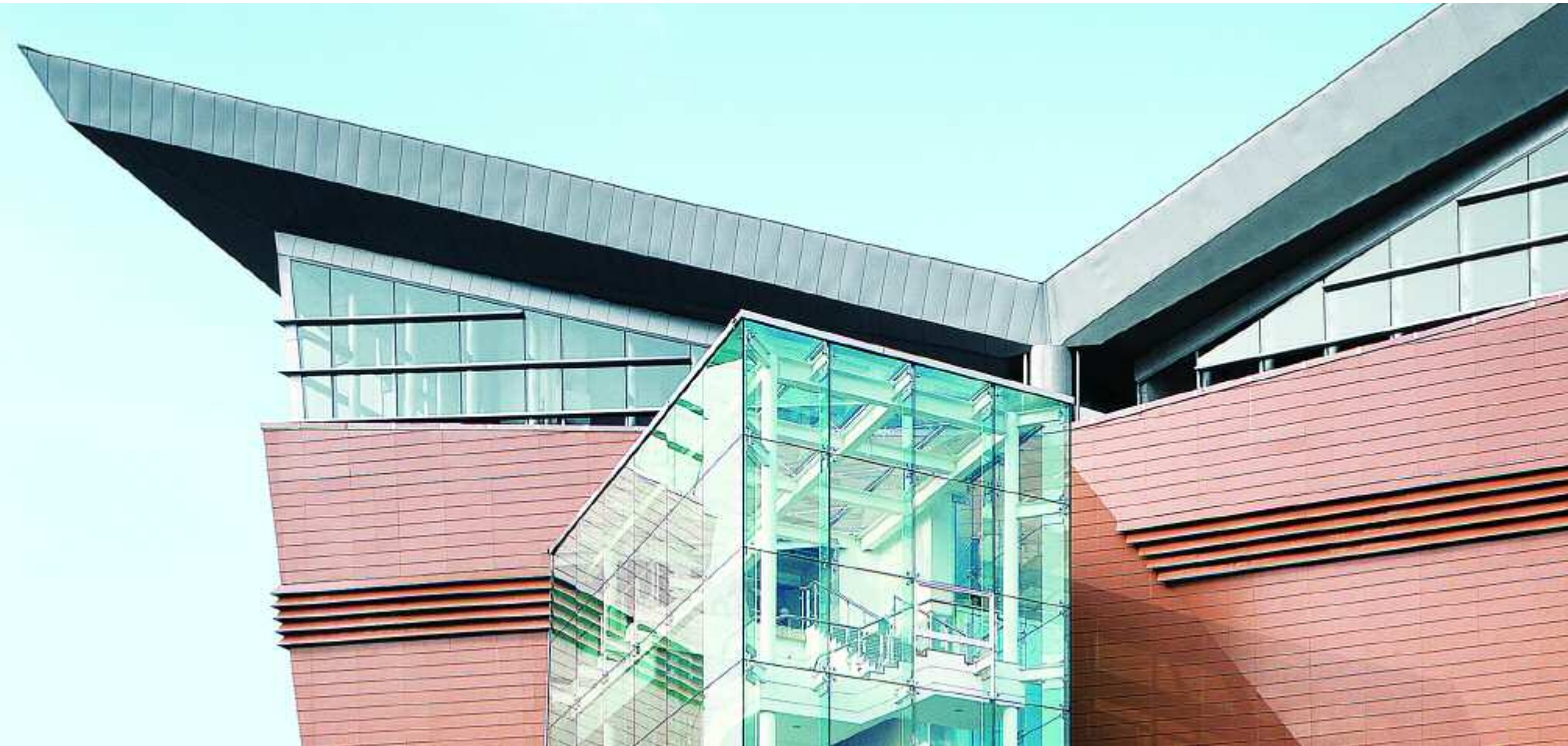
Abb. links: Il San Gwangsung Church, Seoul/Korea Architekt: Hanaplus