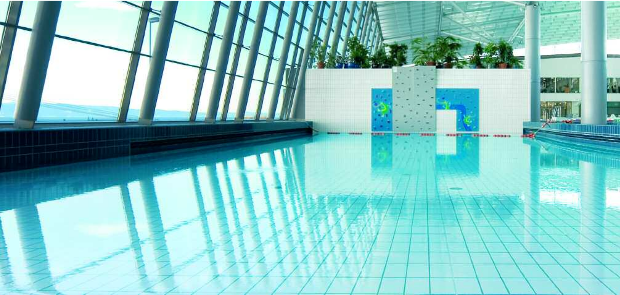
Abb. links: Pirbadet, Trondheim/Norwegen Architekt: Per Knudsen Arkitektkontor AS

Abb. Mitte: Tesoma Swimmingpool, Tampere/Finnland Architekt: Kysoy Arkkehtuuria