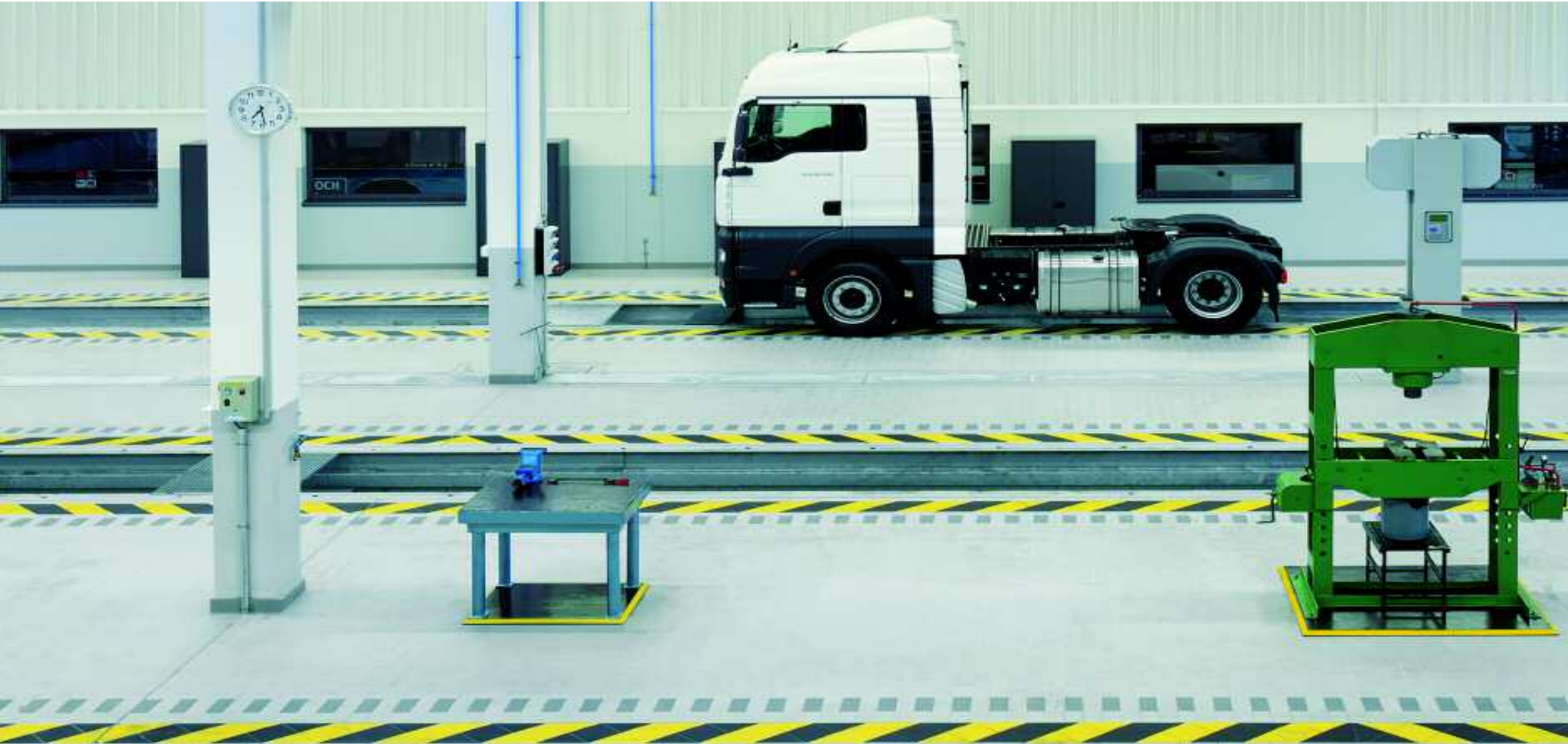
Abb. links: MAN Service Station, Oldenburg/Deutschland