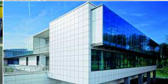
Abb. Titel (v.l.n.r.):