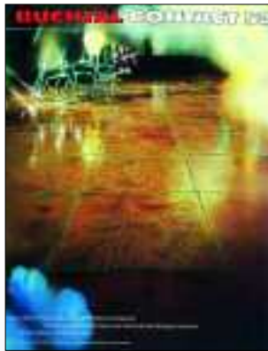
Titelseite CONTACT 52, 1977