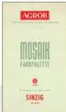
Mosaik Farbpalette, 1958