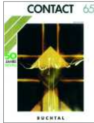
Titelseite CONTACT 65, 1987