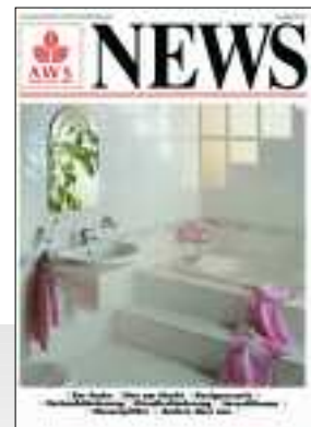
AWS NEWS, 1991