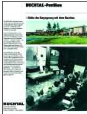
Rückseite CONTACT 52, 1977