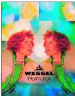
WESSEL Information, 1973