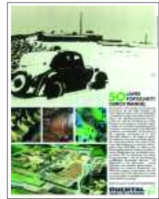
Rückseite CONTACT 65, 1987