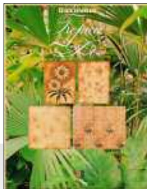
SERVAIS Produktblatt, 1978