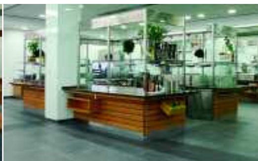
Repräsentative Räume Gastronomie