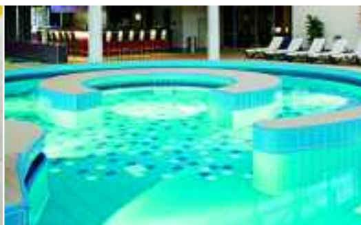
Schwimmbäder und Wellnessbereiche